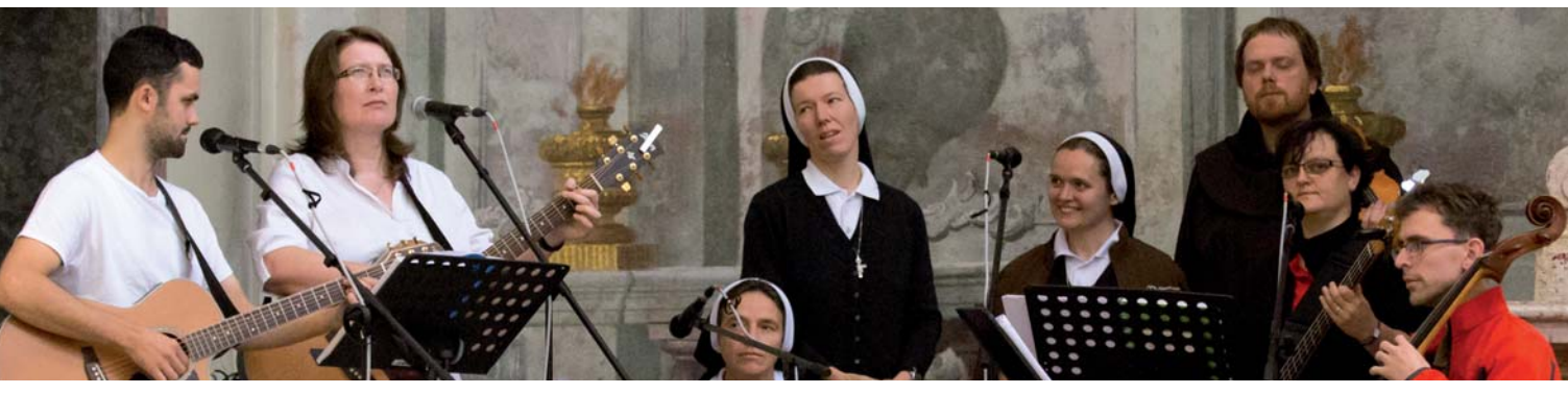
Výběr hudby k bohoslužbám